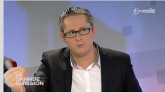
TV Vendée - La Grande Emission