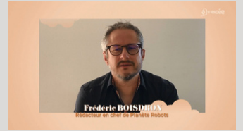
TV Vendée - Revue de presse