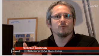
TV Vendée - Le Journal