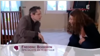
France 2 - C'est au Programme