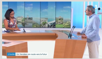
France 3 - L'invité