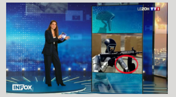
TF1 - Le Journal