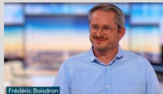
France 3 - Le Journal