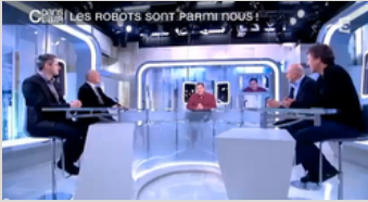
France 5 - C'est dans l'Air